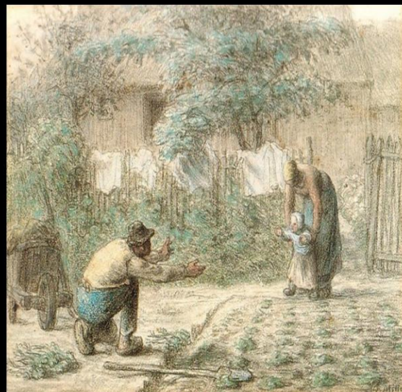
Les premiers pas : Millet - 1853