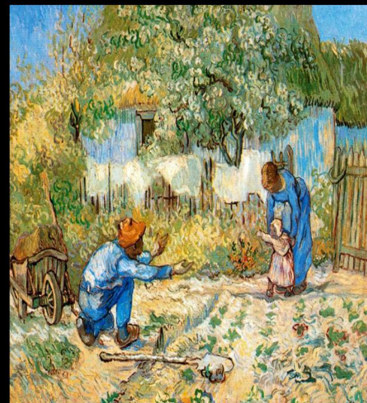
Les premiers pas : Van Gogh - 1890